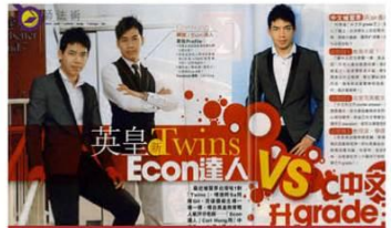
中文升grade王 洪sir最權威《新Monday》