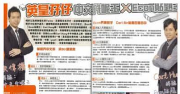
補習中文升呢王最架勢《YES》