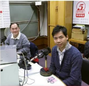
為學友社及RTHK聯合舉辦之電台節目《奮發時刻DSE》擔任嘉賓