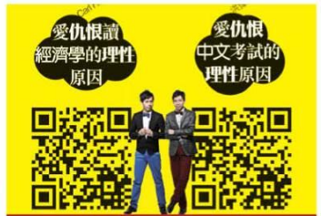
2013《黑紙》分享中文教學心得