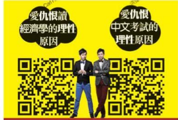
2013《黑紙》分享中文教學心得