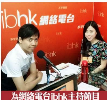
為網絡電台ibhk主持節目《洪門會》