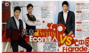
中文升grade王 洪sir最權威《新Monday》