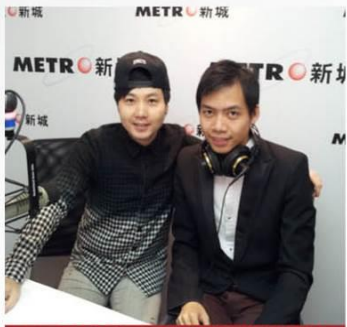
接受新城電台訪問教學心得