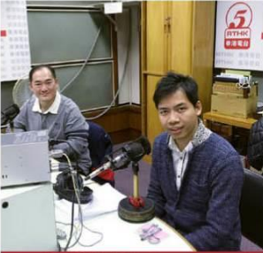
為學友社及RTHK聯合舉辦之電台節目《奮發時刻DSE》擔任嘉賓