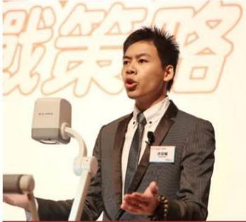
2013 DSE九展大型講座主講嘉賓