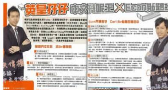
補習中文升呢王最架勢《YES》