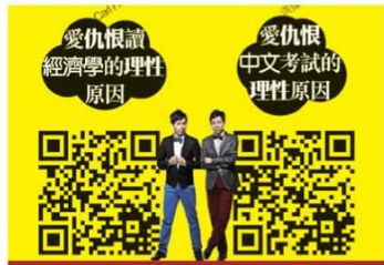
2013《黑紙》分享中文教學心得